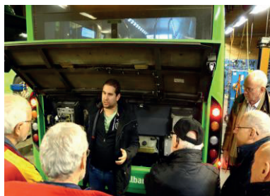
Text: Sven Eriksson

Föredraget ledde till ovanligt aktiva diskussioner där vi fick bra och klarläggande svar från föredragshållarna. Vi fick också provsitta en av de nya bussarna och se all ny teknik, bl.a. väldigt trevlig ljussättning i bussen och kompissoffan längst bak i bussen. Avslutningsvis tog Sammy oss med på en "night ride" med bussen och vi fick känna hur tyst och mjukt den stora bussen gled runt i kvällstrafiken på Kirseberg där Nobinas terminal ligger.